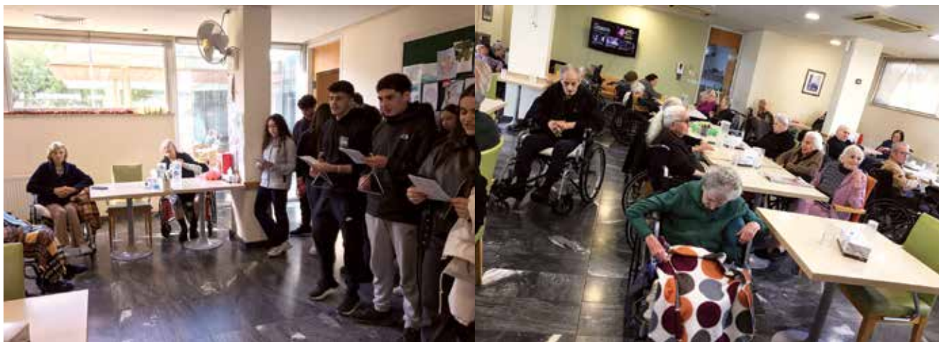
Κάλαντα και ευχές αγάπης από τους μαθητές και τις μαθήτριές μας στο γηροκομείο «Ματέρια» στις 20 Δεκεμβρίου.